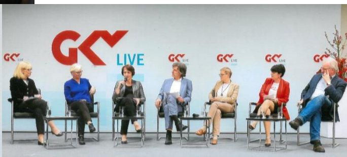
Beide Bilder (oben): Ein kleiner Nachschub von vor zwei Wochen Teilnahme an der Podiumsdiskussion der Gesetzlichen Krankenversicherung zum Thema „Entlastung von Versicherten – Versorgung verbessern“ am 10.10.2018.